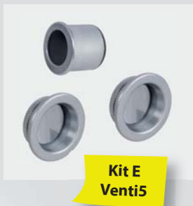
Kit E Venti5